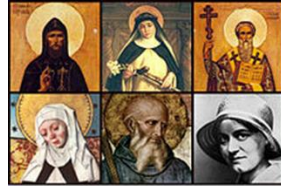
Los 6 patronos de Europa