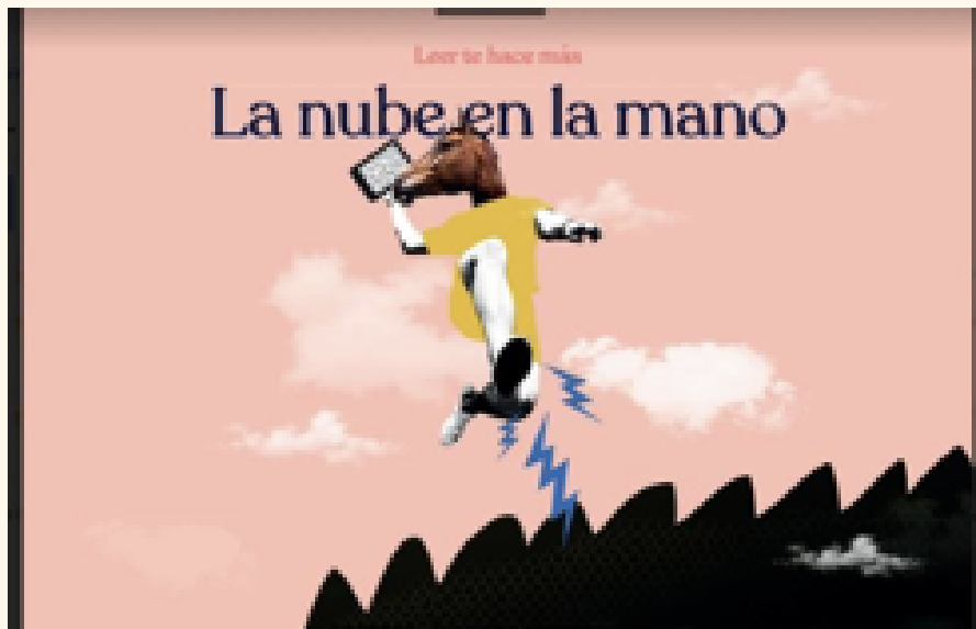
Musa a las 9 e Instituto Cervantes